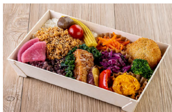
ベジタリアンおもてなし弁当 グルテンミートのそぼろごはん 豆乳コロッケ、 無農薬テンペのソテーなど 1720円【税抜】