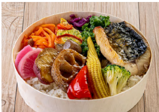
10種野菜と鯖の塩焼き弁当 ビタミンミネラルが豊富な有機野菜が 10種も入ったお弁当 脂が乗ったサバを塩焼きに 1280円【税抜】