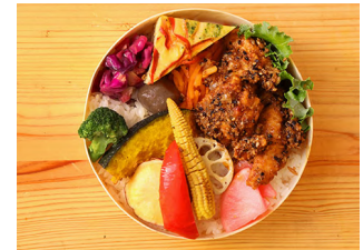
10種野菜と胡麻香り揚げ弁当 ビタミンミネラルが豊富な有機野菜が 10種も入ったお弁当 秋川牧園鶏のから揚げを胡麻たっぷり ソースでからめました。 1370円【税抜】