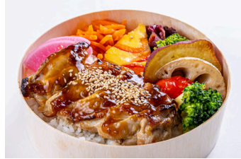
秋川牧園鶏の照り焼き弁当 飼料からこだわった健康鶏を ボリュームある弁当に。 外国のゲストにも人気。 1350円【税抜】