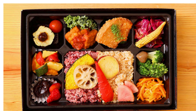
ベジタリアンオーガニック 盛り合わせ弁当 有機野菜たっぷり、車麩のカツや テンペのサルサソースなど 2400円【税抜】