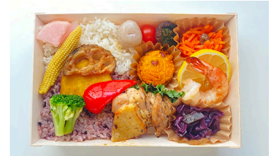
グルテンフリー弁当 グルテンを含むすべての食品を除去し ています。醤油も小麦不使用の たまり醤油を使用しています。 1850円【税抜】