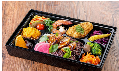
特選オーガニックおもてなし弁当 会議や接待の定番弁当 鶏の照り焼きチキンや、天然海老の塩焼き 旬野菜のオムレツなど、 10種のおかずを盛り合わせ 2370円【税抜】