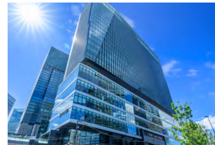
INOGATE OSAKA bldg. IIF