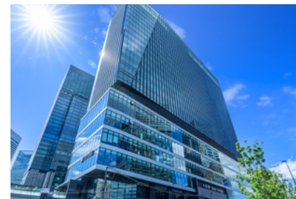
INOGATE OSAKA bldg. 11F