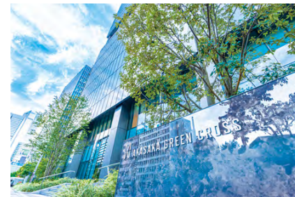
AKASAKA GREEN CROSS bldg. 4F